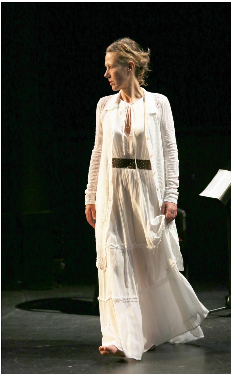
"Les Indes" d'Edouard Glissant par Sophie Bourel